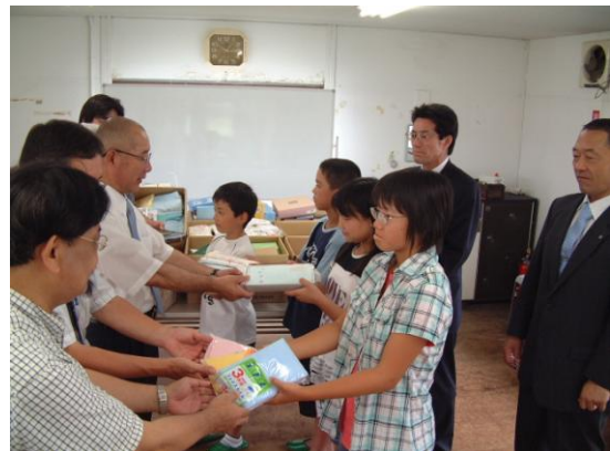
松川電氣社員様のお子様より寄贈品を頂きました。

松川電氣様及び、従業員とそのご家族様からの寄贈品及びご寄附につきましては今年で五回目となります。松川電氣様をはじめ、地域の方々の力強いご支援を受けながら、今後も地域の拠点施設の担い手として、地域福祉に取り組んでいきたいと思っております。